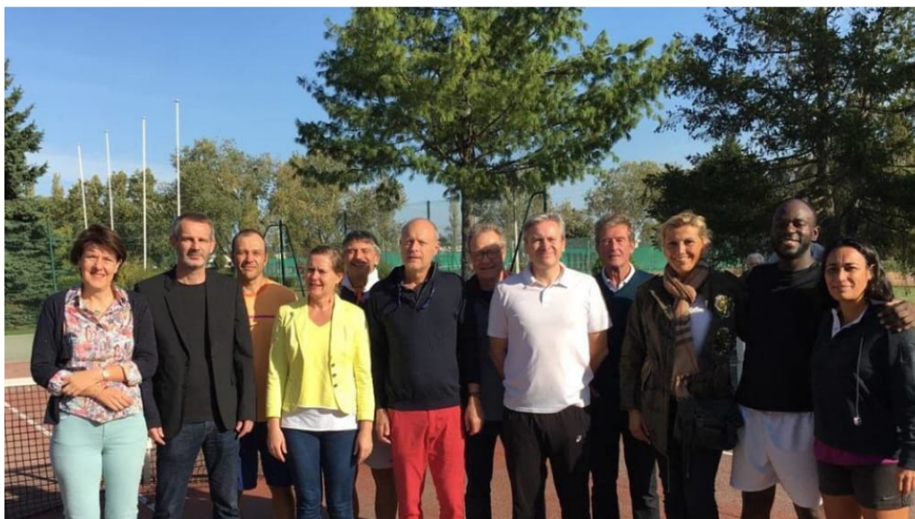
Une nouvelle équipe dirigeante à l'ATGT.