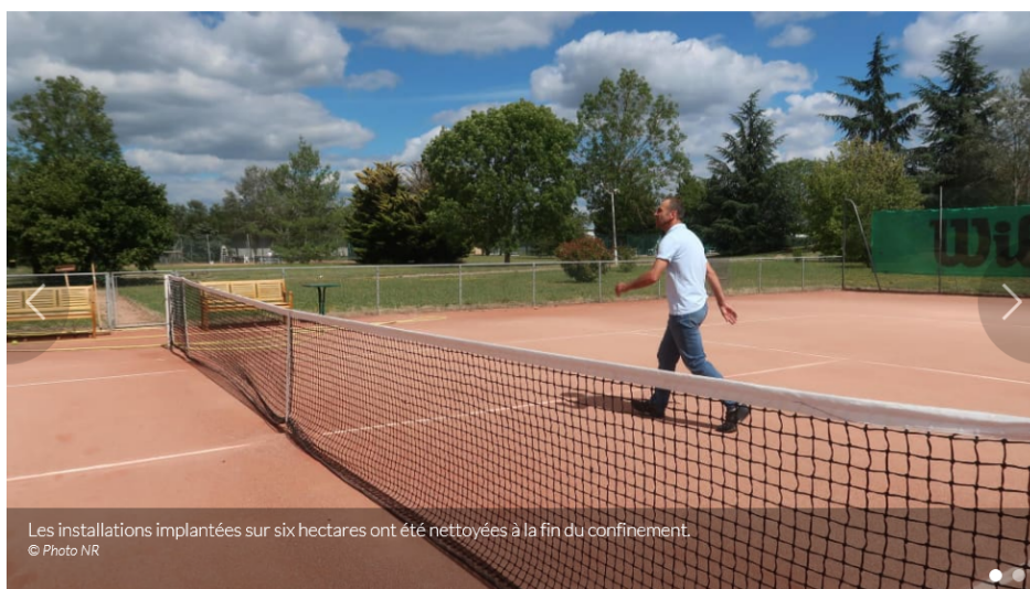
Les installations implantées sur six hectares ont été nettoyées à la fin du confinement.

Le club de la Vallée du Cher dispose de six hectares de verdure et de vingt- et-un courts. C'est ici que Yannick Noah était devenu champion de France.